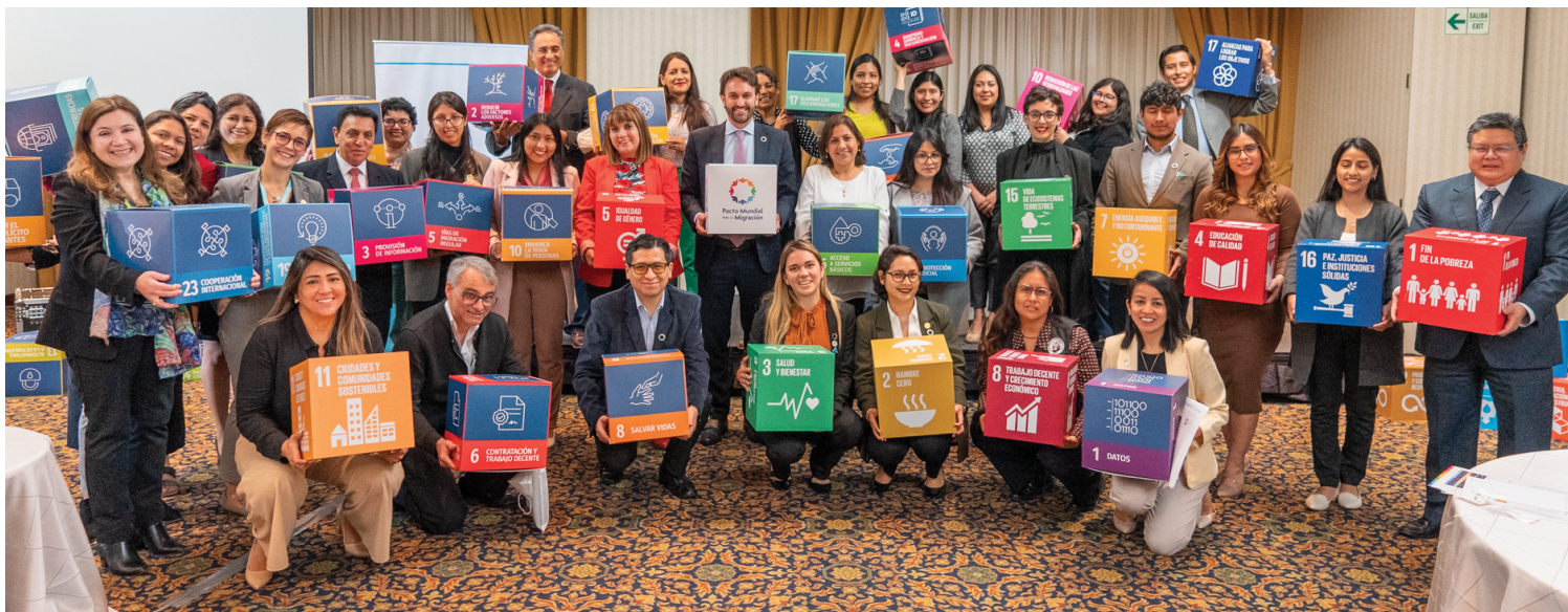
▲ Evento de vinculación de los objetivos del PMM con los ODS.